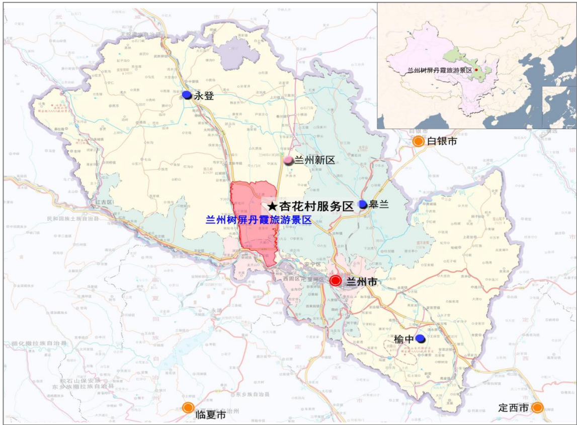
杏花村水墨丹霞主题服务区与兰州水墨丹霞位置关系图